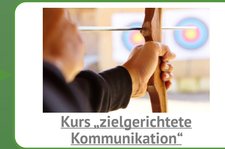
Kurs „zielgerichtete Kommunikation“