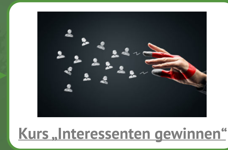
Kurs „Interessenten gewinnen“