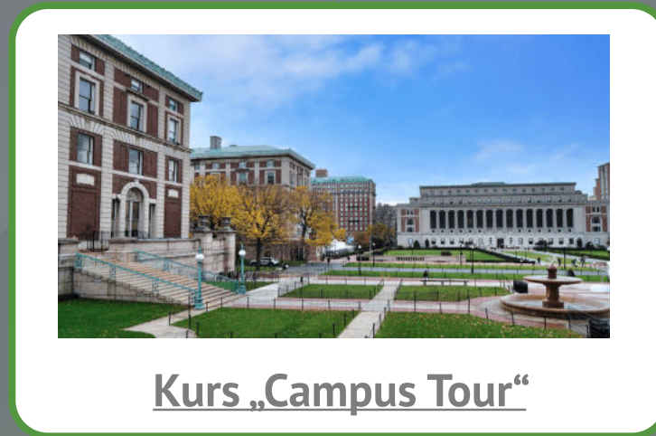
Kurs „Campus Tour“